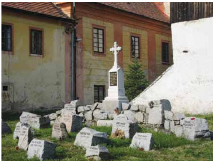
Velmi zajímavě je v Obříství řešen pomník obětem 1. světové války

Dále v Obříství narazíme na morový sloup, připomínající konec morové epidemie roku 1714. Při svém putování nemůžeme zapomenout ani na významné osobnosti, které jsou s Obřístvím spojovány – v č.p. 83 bydlel básník, prozaik a novinář Svatopluk Čech a v Obříství – Semilkovicích se v č.p. 12 nachází areál, který je hodnotným příkladem zděné architektury vesnice z počátku 19. století. Toto místo často navštěvoval Bedřich Smetana, který zde skládal operu Prodaná nevěsta.