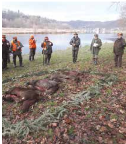
Výřad a zakončení naháňky

udržet stavy černé zvěře v honitbě na optimální úrovni tak, aby se minimalizovaly škody na honebních i nehonebních plochách.